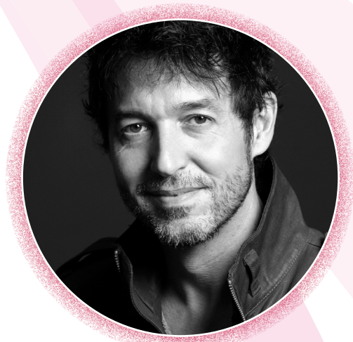
Miguel Ángel Vivas